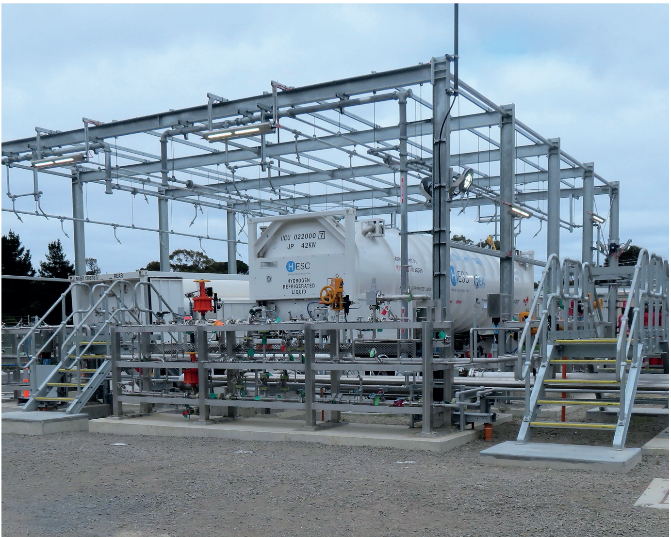
在澳大利亚维多利亚州的Hastings进行氢气供热试制项目。